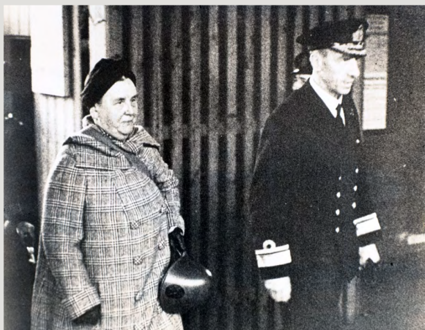
Koningin Wilhelmina vlucht naar Londen.