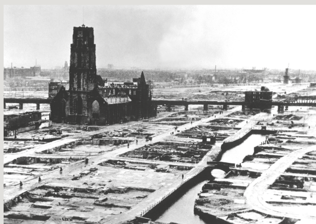
Bombardement op Rotterdam. Hierna geeft Nederland zich over.