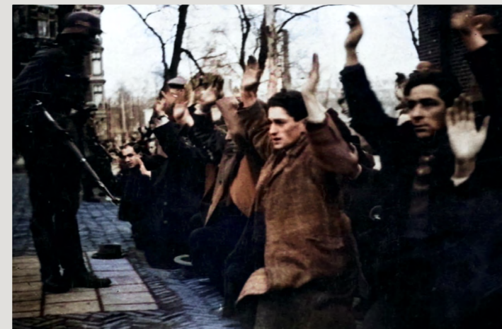
Razzia's in de Jodenbuurt van Amsterdam. Ongeveer 400 Joodse mannen worden opgepakt.